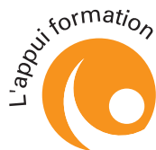
PLATE-FORME nouveaux services BASSE - NORMANDIE