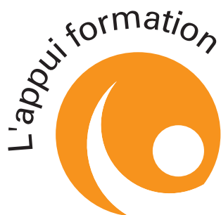
PLATE-FORME nouveaux services BASSE - NORMANDIE